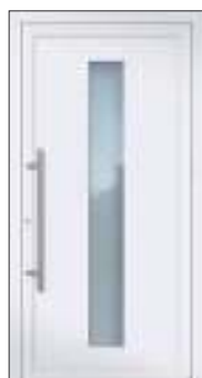
Höhe: 2.000 mm

Die Motivgrößen (Glasfelder) bleiben in der Höhe immer gleich und werden nicht individuell angepasst. Entsprechend wird bei abweichendem Höhenmaß der obere oder untere verbleibende Füllungsrand kleiner bzw. größer.