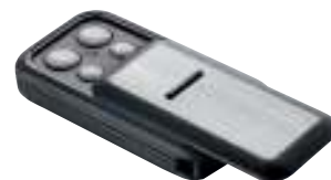
699626 Handsender Slider