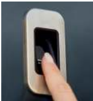
22052 ENTRASys+ FD