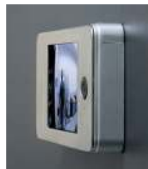
27411 Monitor aufgesetzt