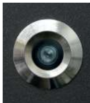
Groke Linse IP65