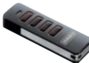
699252 Handsender Pearl