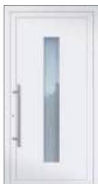
Höhe: 2.240 mm